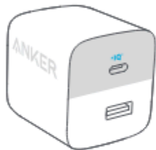
Anker 323 punjač (33W)